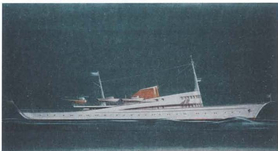
Motoryacht für den Scheich von Kuwait, 1961, Hamburgisches Architekturarchiv